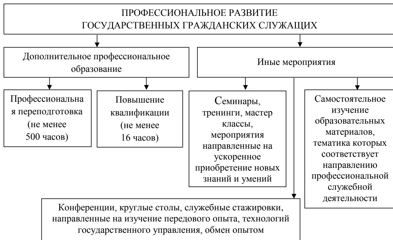
Рисунок 1 – Характеристика профессионального развития государственных гражданских служащих

– Указ Президента Российской Федерации от 21 февраля 2019 г. № 68 «О профессиональном развитии государственных гражданских служащих Российской Федерации»;