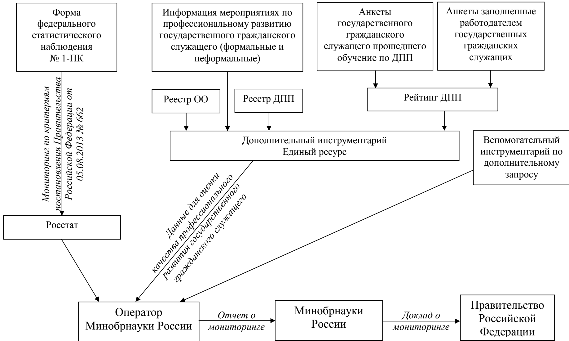
Рисунок 3 – Порядок применения основного, дополнительного и вспомогательного инструментария сбора данных